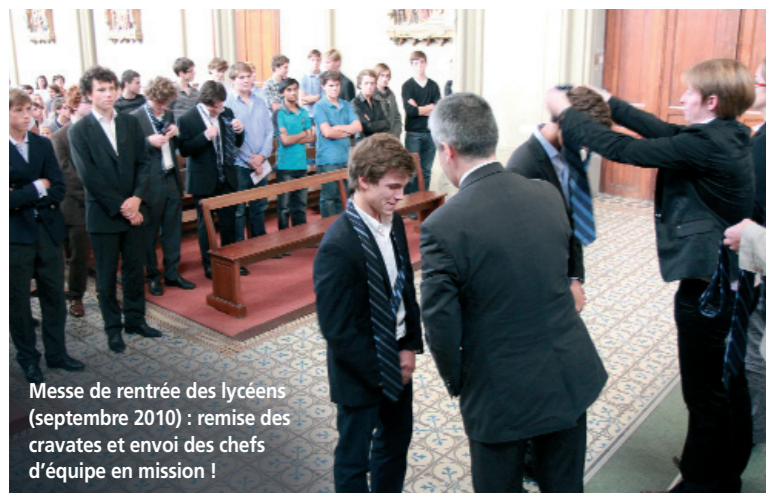
Messe de rentrée des lycéens (septembre 2010) : remise des cravates et envoi des chefs d'équipe en mission !

Quel serait le sens du projet de restauration de la chapelle... s'il n'était pas résolument tourné vers les élèves ? La spécificité de notre projet réside dans le fait que la chapelle de Saint-Joseph est située au cœur d'un établissement scolaire, dont la Pastorale est par ailleurs particulièrement dynamique !