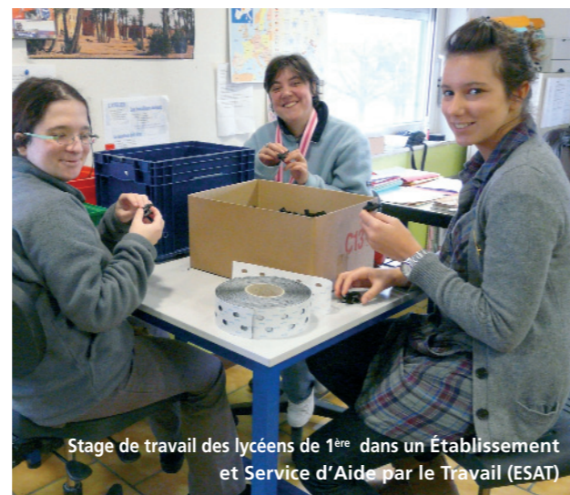
Stage de travail des lycéens de 1 ère dans un Établissement et Service d'Aide par le Travail (ESAT)

Mais la Pastorale de Saint-Joseph, c'est aussi, tout simplement, ces messes hebdomadaires où les collégiens et les lycéens se retrouvent pour prier. « Ça nous change des messes de vieux dans nos campagnes » expliquent-ils. « Ça casse l'image du catho qui ne va à la messe que le dimanche sans que ça ne change rien à sa vie ». « Pour moi », témoigne encore une lycéenne, « un mardi sans messe, c'est la cata ! »