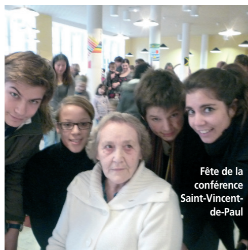
Fête de la conférence Saint-Vincent-de-Paul

Ce sont les 70 lycéens qui rendent visite chaque semaine à des familles en situation sociale difficile, dans le cadre de la conférence Saint-Vincent-de-Paul, pour leur apporter un soutien à la fois moral et matériel (nourriture et bons de gaz).