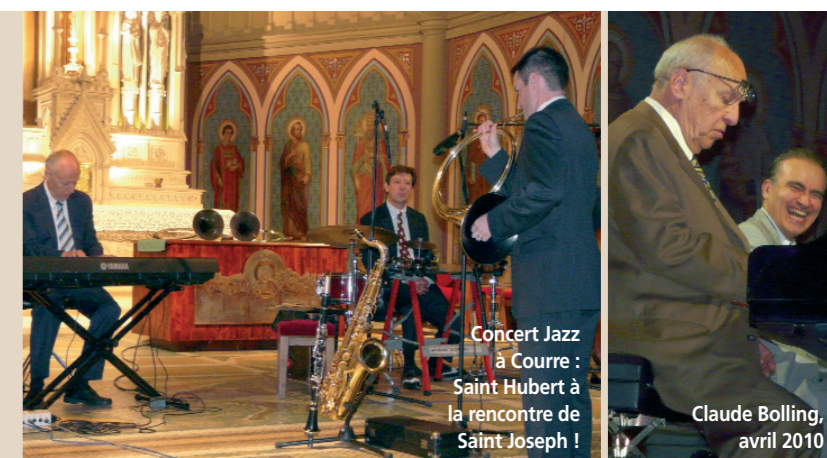
Concert Jazz à Courre : Saint Hubert à la rencontre de Saint Joseph !

Agenda : 27 novembre 2010 - 20h30 Chapelle de Saint-Joseph Les Chœurs de Nicolas de Grigny