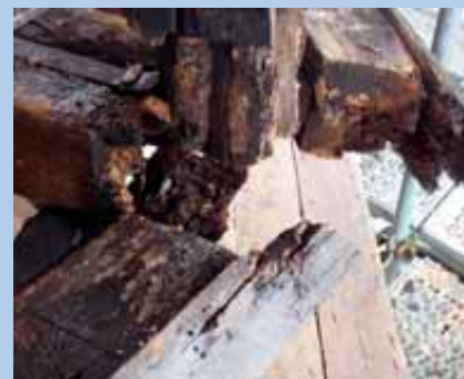
La charpente de la flèche avant...