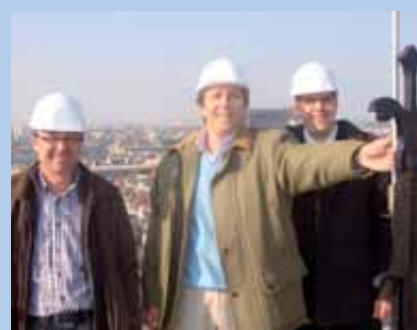
On n'est pas prêt de remonter en haut des échafaudages qui culminaient il y a encore quelques mois à 60 mètres de hauteur !