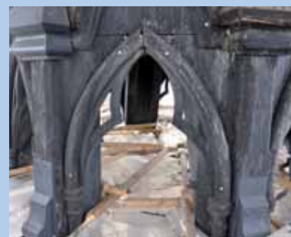
La charpente de la flèche après !