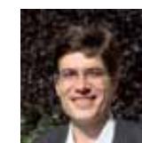
Raphaël GASTÉBOIS Architecte des Bâtiments de France