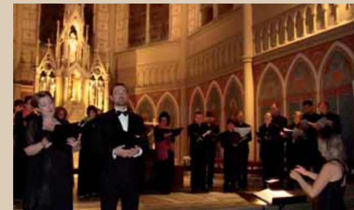
Concert du 17 septembre, le Chœur Opéra Lyre de Paris

Par ailleurs, 300 personnes sont venues visiter la chapelle à l'occasion des journées du patrimoine. Autant d'occasions de sensibiliser les Rémois à la valeur architecturale de notre grande chapelle.