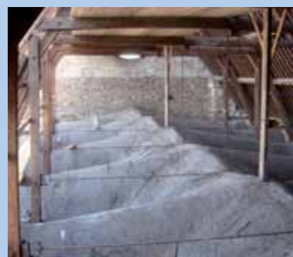
La charpente de la nef.