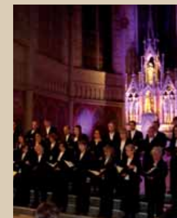
Concert du 8 octobre, le Chœur Nicolas de Grigny