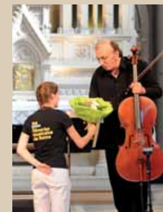
Les Flâneries musicales de Reims